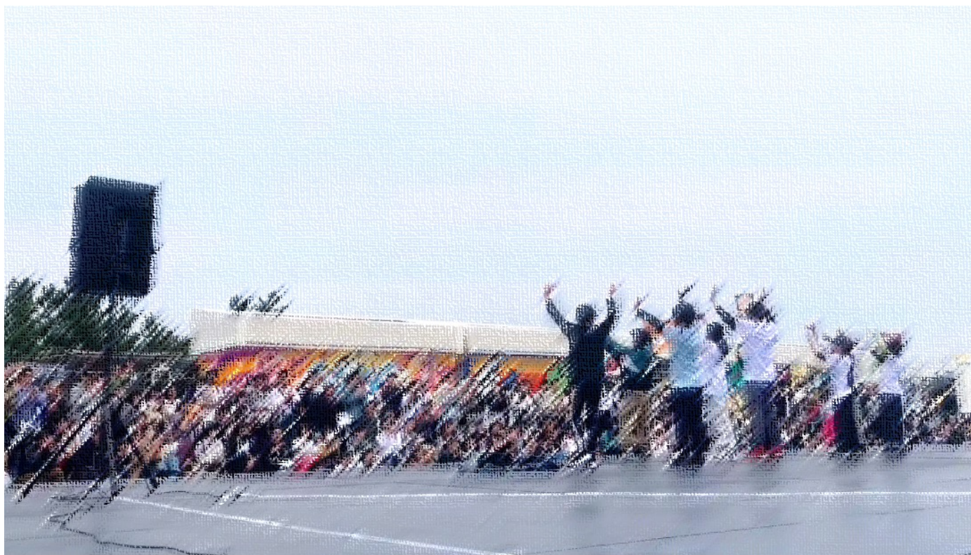
▼大阪府泉南市りんくう南浜4-201 海のマルシェ